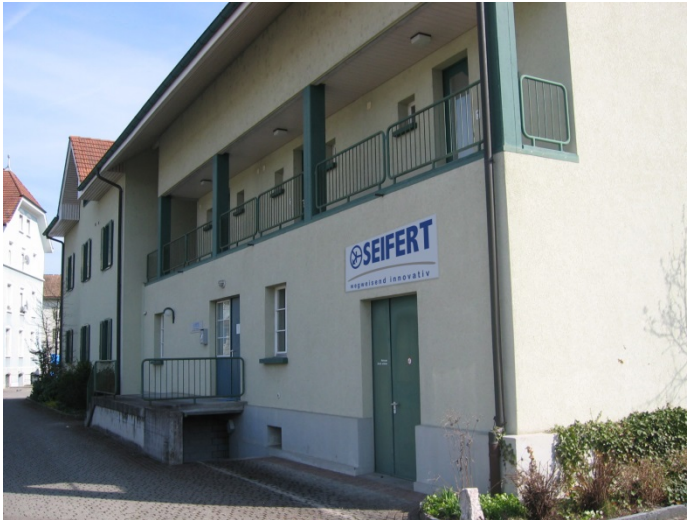
Bild: Seit 30 Jahren beliefert die Schweizer Niederlassung von Seifert Systems verschiedenste Industriesparten mit modernster Klimatisierungstechnik

Bilder: Zeichen: 1.785 Dateiname: 201807010_pm_30jahre-schweiz Datum: 02.08.2018